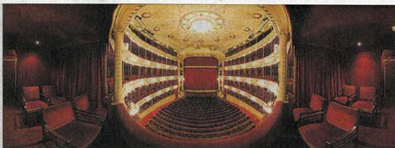
Teatro Solís. El escenario y su aforo, en una vista panorámica.

Para elegir los sitios a incorporar, los creadores de la página tienen en cuenta que el lugar rinda