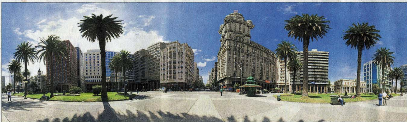
Plaza Independencia. Es una de las varias plazas montevidéanas que se pueden recorrer como parte de los tours virtuales de la capital.

PANÓPTICO. La navegación por el sitio es muy fácil, incluso para aquellos poco afectos a la red. La dirección es http://uruguay360.com.uy/ . Una vez ahí, si ingresa a la etiqueta "Uruguay" verá cómo se despliegan debajo fotografías de distintos lugares. Basta click en uno, para acceder al recorrido virtual por ese espacio. De esta manera, puede pararse en la mitad de la Plaza de Toros de Colonia y obtener una vista total desde ese punto, tal