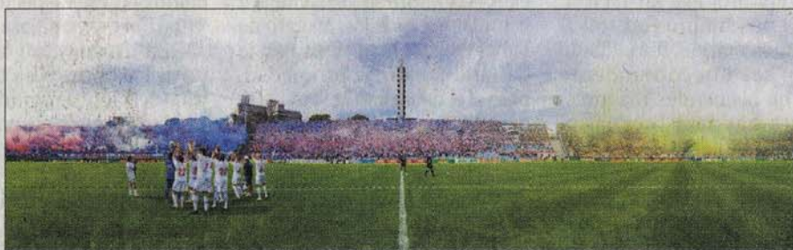
Estadio Centenario. Hay tours del clásico pasado, desde mitad de cancha.