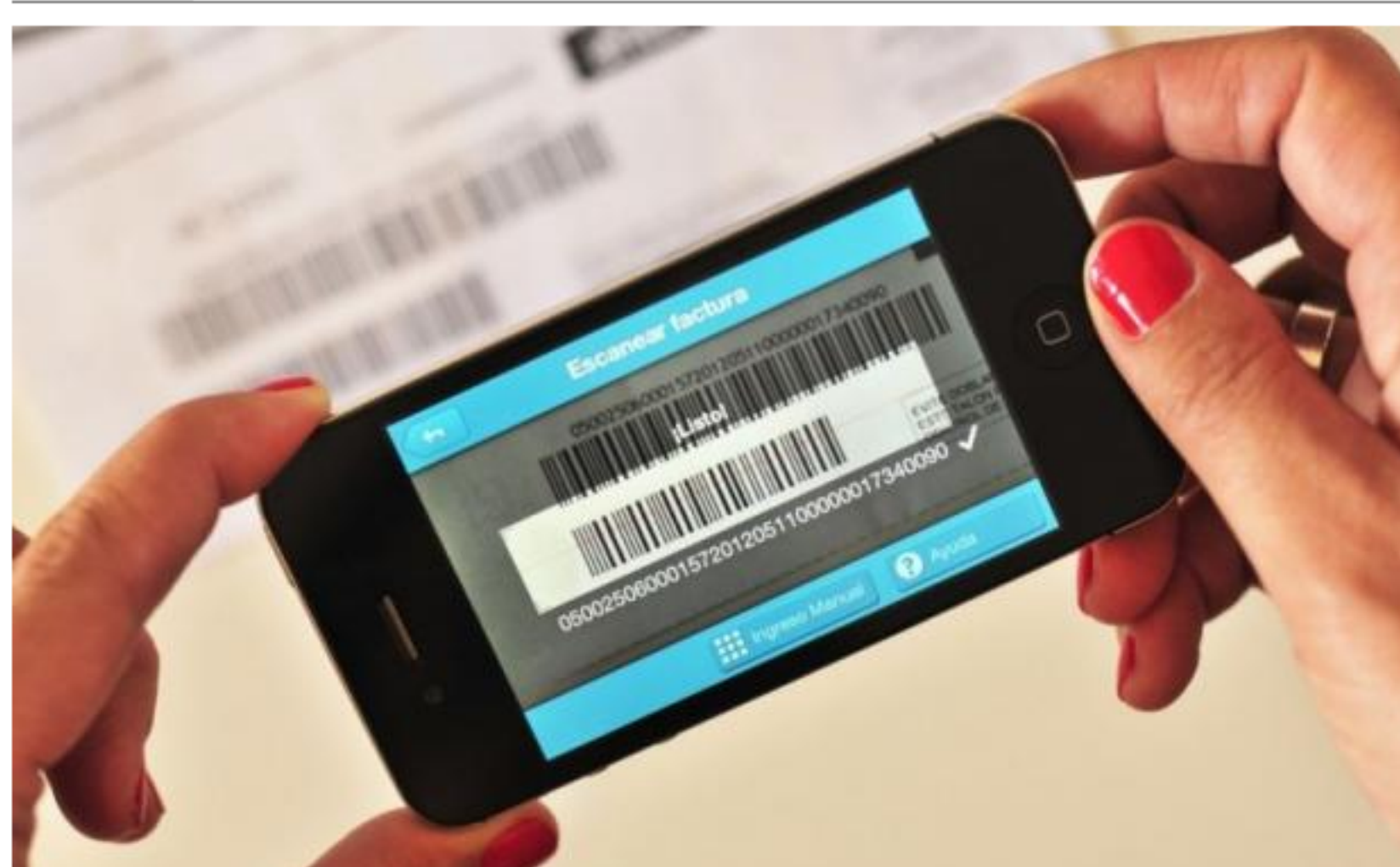
La aplicación Paganza escanea facturas y permite pagarlas por un débito automático.