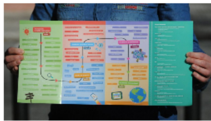
MEGA EXPERIENCIA ENDEAVOR

Historias que sirven de inspiración a las mentes emprendedoras