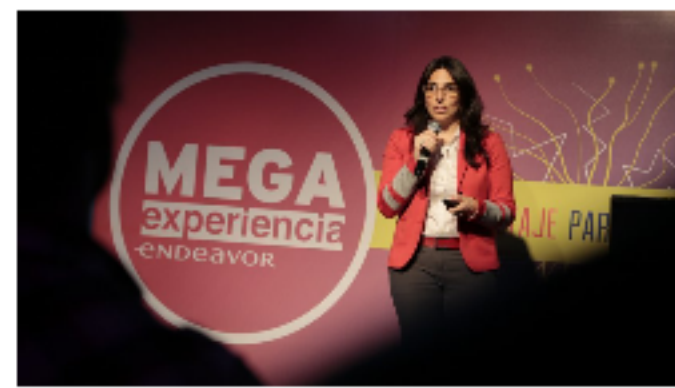
MEGA EXPERIENCIA ENDEAVOR

Endeavor presentó el Mapa del Ecosistema Emprendedor