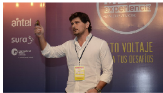
MEGA EXPERIENCIA ENDEAVOR

Historias que sirven de inspiración a las mentes emprendedoras